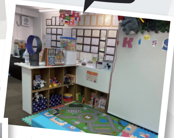
充実のキッズルーム 兄弟で来校も大歓迎!