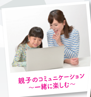
親子のコミュニケーション ～一緒に楽しむ～