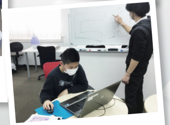
個別指導で 成長スピードが速い!