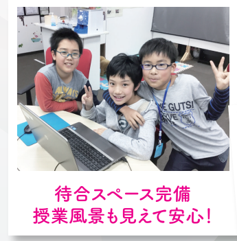
待合スペース完備 授業風景も見えて安心!